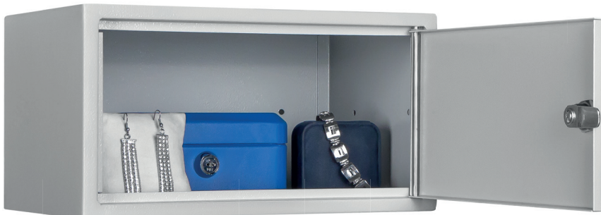
Dekoration nicht im Lieferumfang enthalten • decoration not included in the delivery