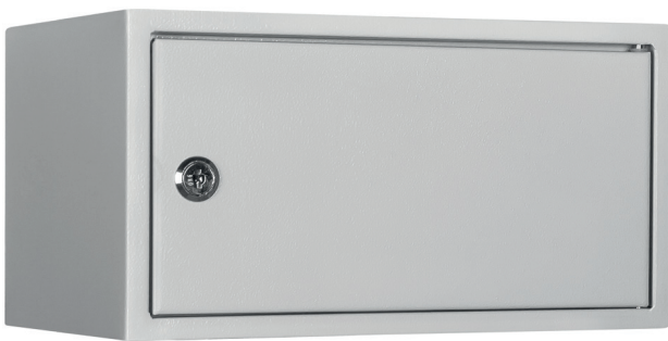
WF 3 Lichtgrau • light grey

No recommended insured sums available - please check with your insurer