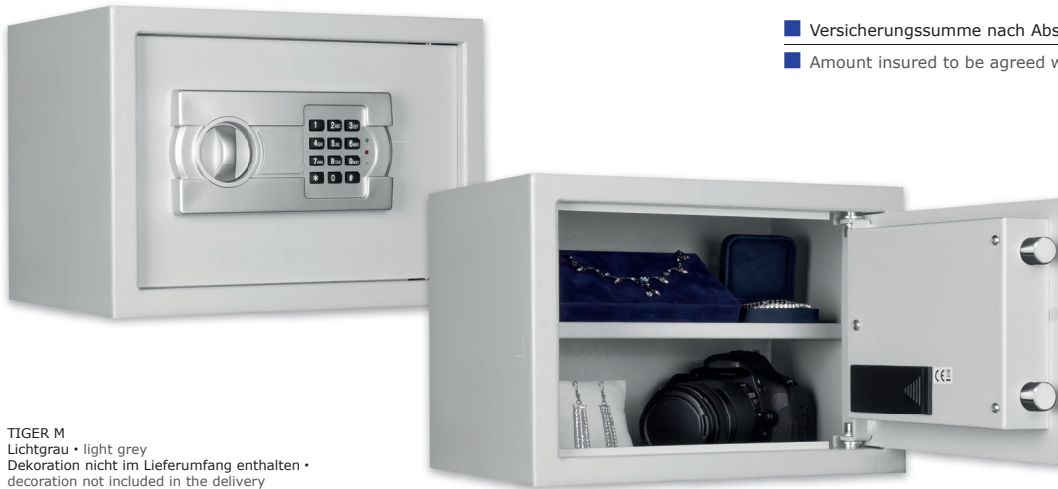
TIGER M Lichtgrau • light grey Dekoration nicht im Lieferumfang enthalten • decoration not included in the delivery

Möbeleinsatztresor mit Elektronenschloss Furniture safe with electronic lock