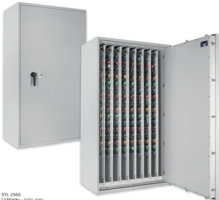
STL 2560 Lichtgrau • light grey Dekoration nicht im Lieferumfang enthalten • decoration not included in the delivery

Schlüssel-/Wertschutzschrank, Grad 0 (EN 1143-1) oder Grad I (EN 1143-1) Key -/safe, Grade 0 (EN 1143-1) or Grade I (EN 1143-1)