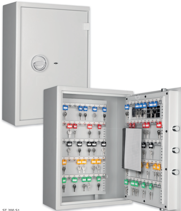
ST 200 S1 Lichtgrau • light grey Dekoration nicht im Lieferumfang enthalten • decoration not included in the delivery

Schlüsseltresor, S1 (EN 14450) und Stufe A (VDMA 24 992) Key cabinet, Security level S1 (EN 14450) and level A (VDMA 24 992)