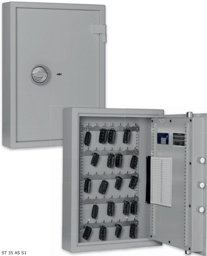
ST 35 AS S1 Lichtgrau • light grey Dekoration nicht im Lieferumfang enthalten • decoration not included in the delivery

Autoschlüsseltresor, S1 (EN 14450) und Stufe A (VDMA 24 992) Car key cabinet, Security level S1 (EN 14450) and level A (VDMA 24 992)