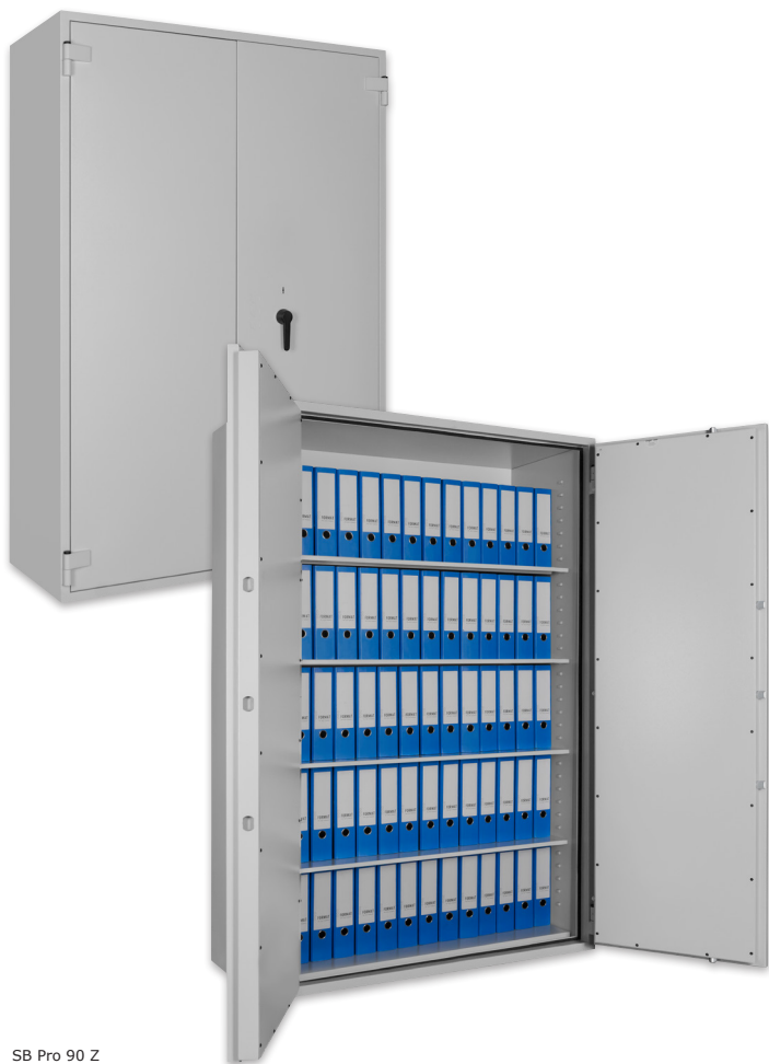
SB Pro 90 Z Lichtgrau • light grey Dekoration nicht im Lieferumfang enthalten • decoration not included in the delivery

Keine empfohlenen Versicherungssummen verfügbar - bitte informieren Sie sich bei Ihrem Versicherer