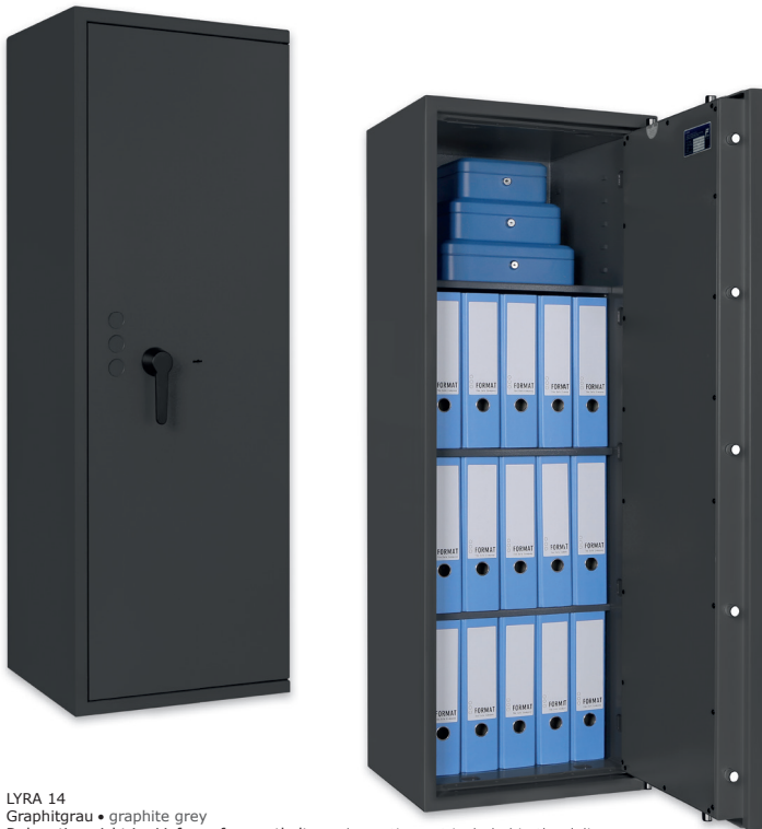
LYRA 14 Graphitgrau • graphite grey Dekoration nicht im Lieferumfang enthalten • decoration not included in the delivery

Wertschutzschrank, Grad I (EN 1143-1) Safe, Grade I (EN 1143-1)