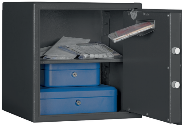
F 2 mit Einwurfschlitz Graphitgrau • Graphite grey Dekoration nicht im Lieferumfang enthalten • decoration not included in the delivery

Keine empfohlenen Versicherungssummen verfügbar - bitte informieren Sie sich bei Ihrem Versicherer