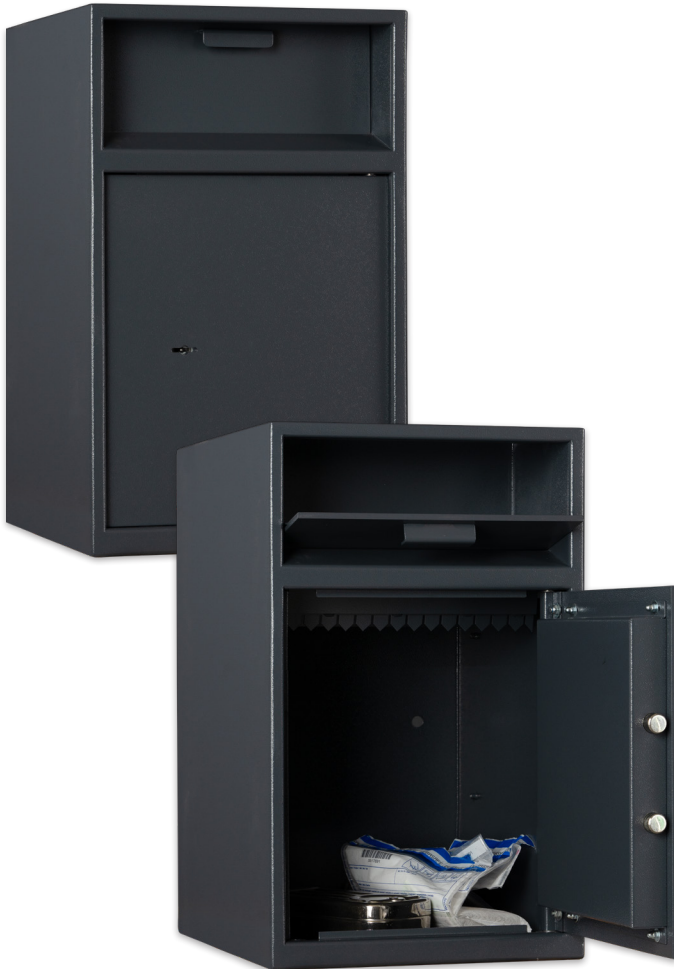
DINERO Plus 45 Graphitgrau • graphite grey Dekoration nicht im Lieferumfang enthalten • decoration not included in the delivery

■ Versicherungssumme nach Absprache mit dem Versicherer