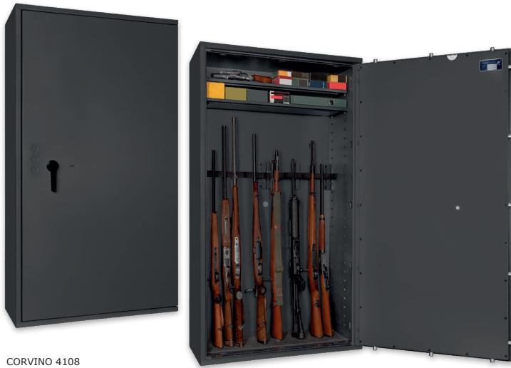
CORVINO 4108 Graphitgrau • graphite grey Dekoration nicht im Lieferumfang enthalten • decoration not included in the delivery

Waffenschrank, Grad I (EN 1143-1) Weapon safe, Grade I (EN 1143-1)