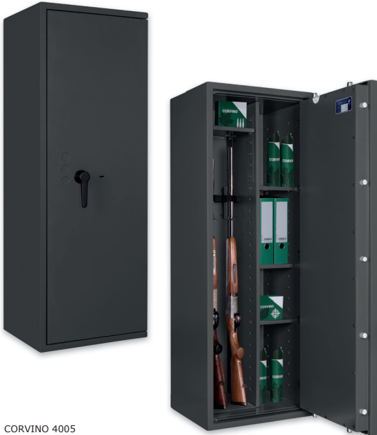
CORVINO 4005 Graphitgrau • graphite grey Dekoration nicht im Lieferumfang enthalten • decoration not included in the delivery

Waffenschrank, Grad 0 (EN 1143-1) Weapon safe, Grade 0 (EN 1143-1)