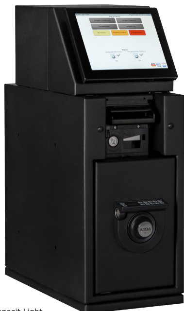
TEBS Deposit Light