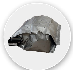
TEBS Deposit Light Safebag