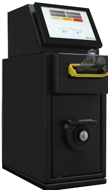
MEI Deposit Light