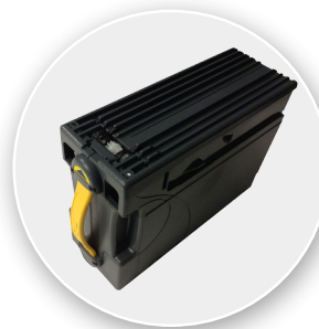
MEI Deposit Light strong box