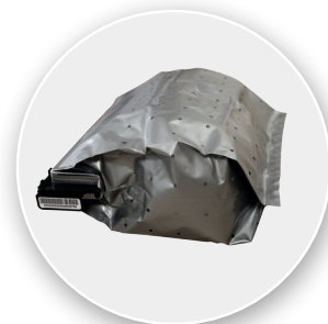
TEBS Deposit Light Safebag