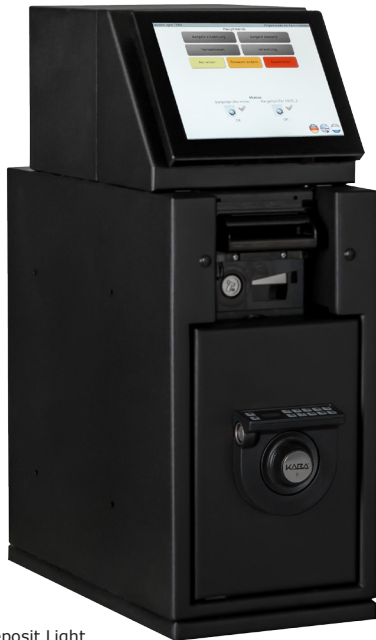
TEBS Deposit Light